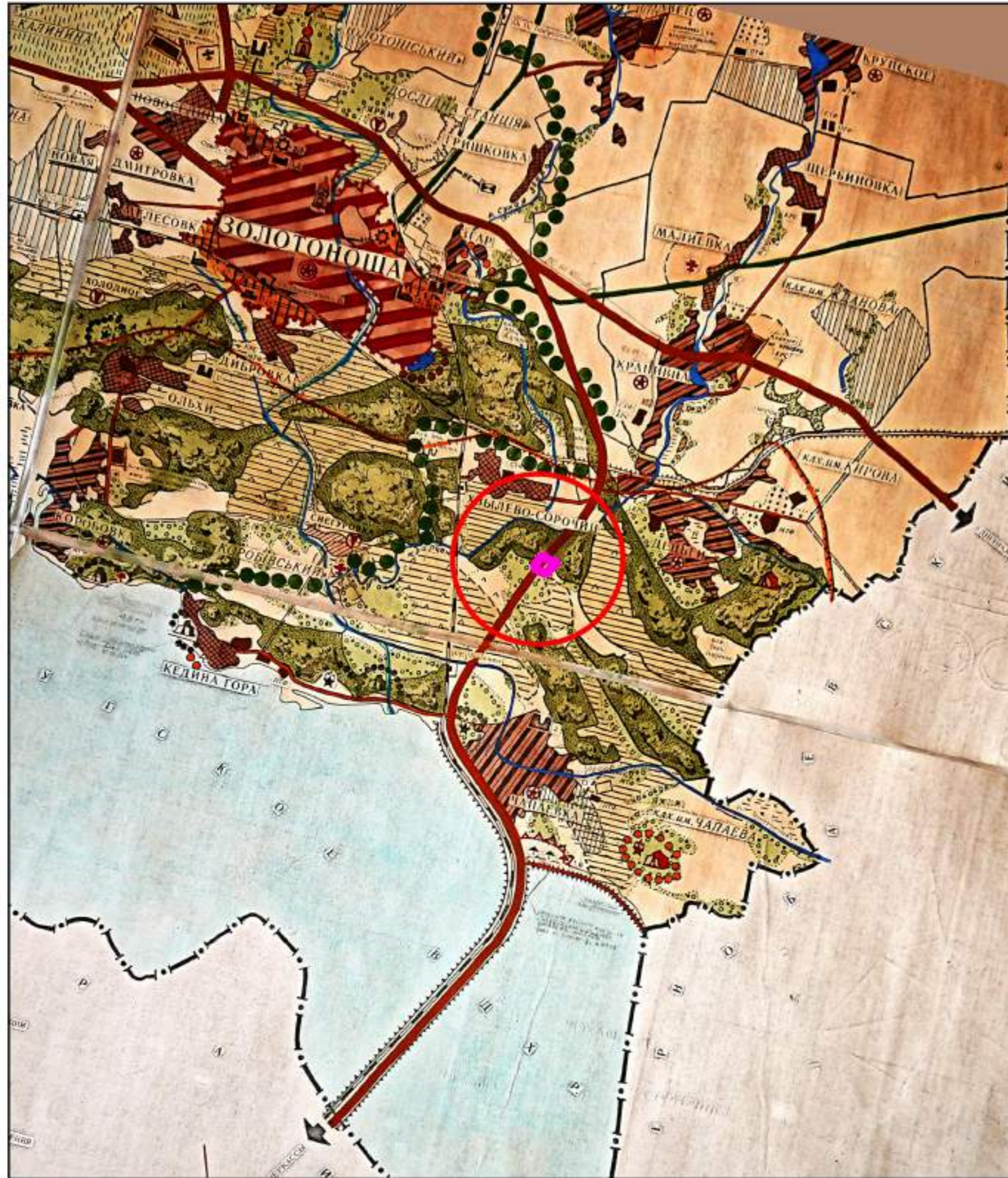
Схема розташування земельної ділянки у планувальній структурі території територіальної громади