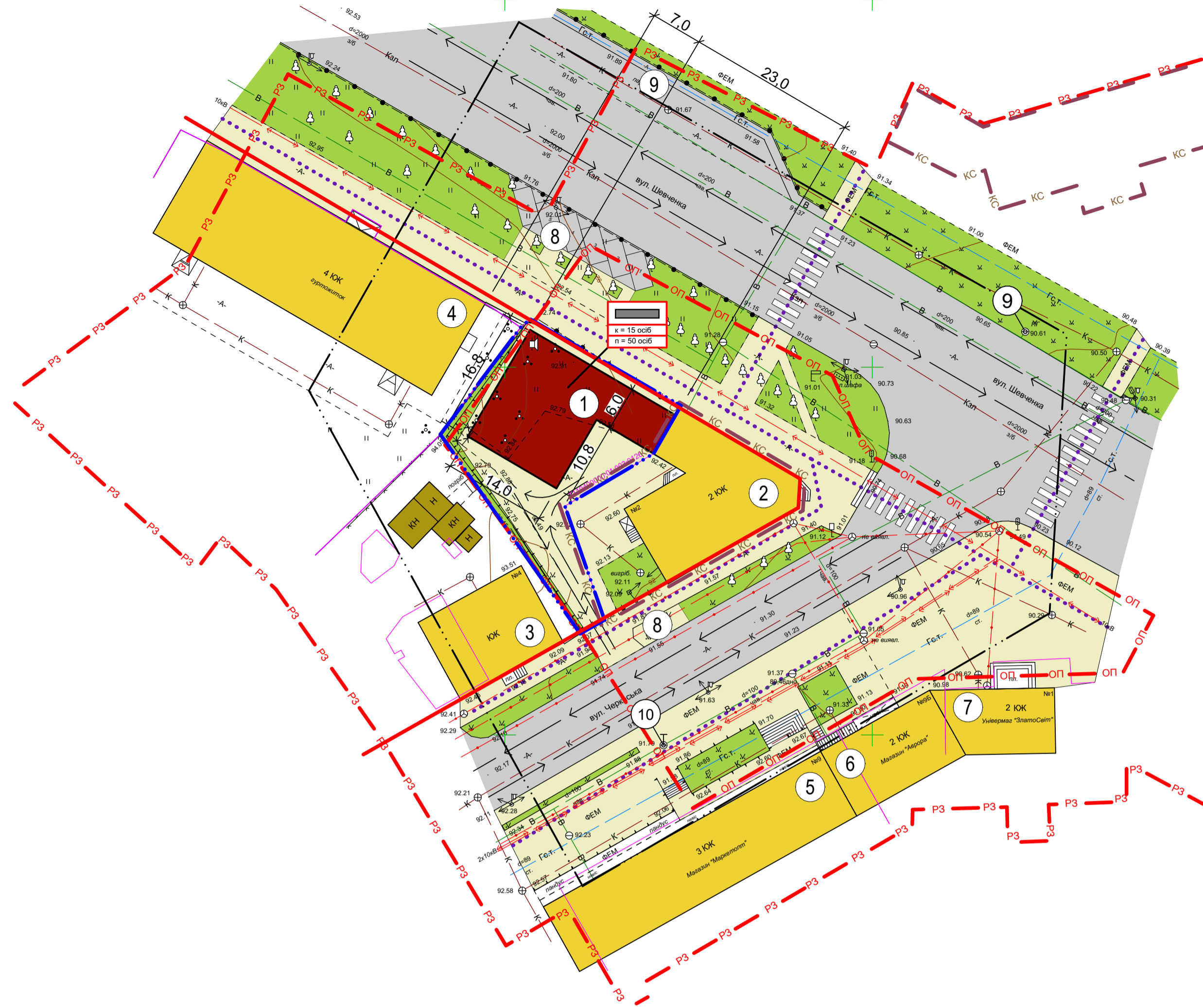
ЕКСПЛІКАЦІЯ БУДІВЕЛ І СПОРУД ДО ПРОЄКТНОГО ПЛАНУ