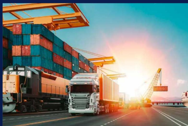
КОНСУЛЬТАЦІЇ З МИТНИХ ПИТАНЬ ДЛЯ ПОЧАТКІВЦІВ ТА ДІЮЧИХ ЕКСПОРТЕРІВ

Консультації з митних питань для початківців та діючих експортерів від експертів Офісу з розвитку підприємництва та експорту спрямовані на допомогу українським підприємцям ефективно організувати та масштабувати свій бізнес на нових експортних ринках.